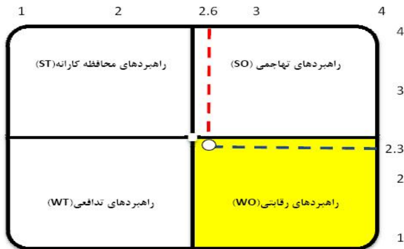
شکل ۵ انتخاب راهبردی توسعه گردشگری مذهبی در منطقه مورد مطالعه

تحلیل SWOT نشان می‌دهد از نظر مردم، عوامل داخلی (قوت‌ها و ضعف‌ها) دارای اهمیتی برابر با ۲/۶ و عوامل خارجی (فرصت‌ها و تهدیدها) دارای اهمیتی معادل ۲/۳ بوده‌اند. به این ترتیب، با عنایت به محور مختصات تهیه‌شده (ر.ک شکل ۵) می‌توان راهبرد رقابتی را برای توسعه گردشگری مذهبی در روستاهای مورد مطالعه براساس رهیافت مردمی پذیرفت.