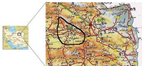
شکل ۱ موقعیت دشت مورد مطالعه

مورد توجه قرار گرفته است. در همین زمینه Yang و همکاران در رودخانه زرد چین مطالعاتی انجام دادند، به این نتیجه رسیدند که شرایط آبیاری در چین تحت تأثیر مستقیم بارش و میزان تبخیر قرار داشته و در دهه‌هایی که بارش بیشتر و میزان تبخیر کمتر بوده امکان آبیاری بهتری فراهم بوده است [۵]. فرت ۱ و وارد ۲ نیز به بررسی اثر برنامه‌ریزی کاربری اراضی کشاورزی بر کیفیت آب زیرزمینی پرداختند. آنها در این بررسی به نقش سموم حاصل از فعالیتهای کشاورزی در آلوده ساختن آبهای زیرزمینی پرداختند و ضرورت سیاستگذاریهای مناسب را برای جلوگیری از این امر توصیه کردند [۶]. در دشت نیشابور نیز مسأله بحران آب، در نتیجه به هم خوردن تعادل هیدرولوژیکی و افزایش تقاضا از منابع آبی از سال ۱۳۶۵ به بعد نمود پیدا کرده است و چنانچه بهره‌برداری به صورت بی‌رویه از منابع آب و الگوی بیلان منفی از منابع موجود، متوقف نشود به تدریج حجم آب شیرین و قابل‌استفاده کاهش خواهد یافت و مسأله بحران آب، منجر به تهی شدن کامل مخازن آب زیرزمینی دشت شده، تمام سرمایه‌گذاریهای انجام شده از بین خواهد رفت. دشت نیشابور، جزئی از حوضه آبریز کال‌شور نیشابور است که در شمال شرق کویر مرکزی واقع شده است. شکل ۱ نشان‌دهنده موقعیت منطقه مورد مطالعه است.